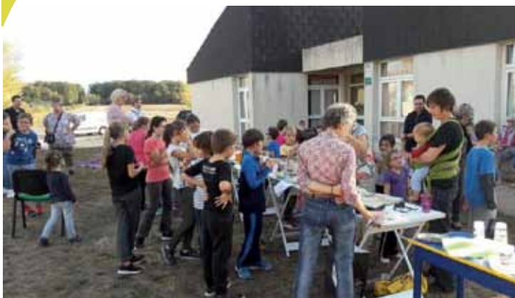
Semaine du goût : goûter pour les enfants et les familles