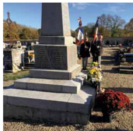
Armistice 11 novembre