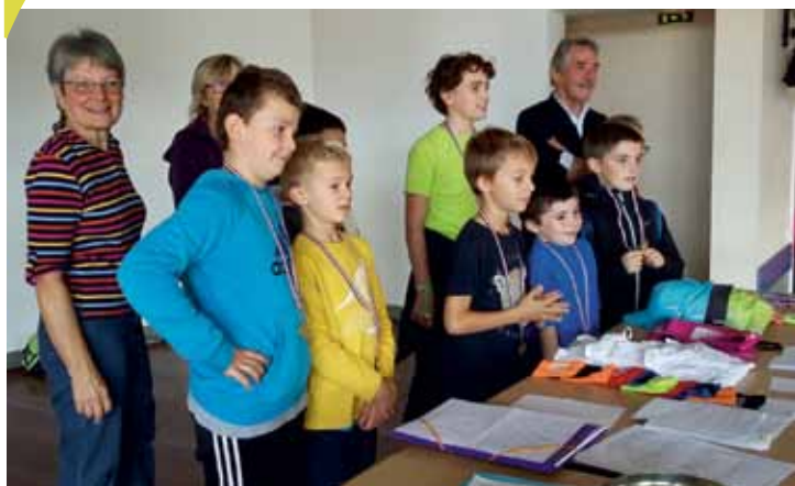
Les jeunes marcheurs récompensés

Superbe journée du 21 octobre 2018 pour les randonnées pédestre et VTT UFOLEP d'Arthon avec 714 marcheurs et 150 vttistes.