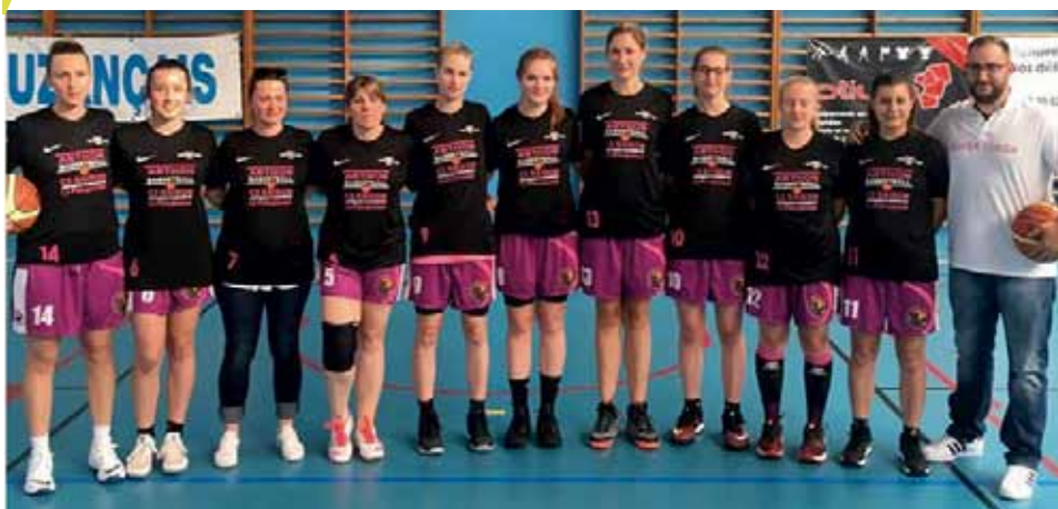
Equipe séniors filles : vainqueur de la coupe de l'indre et championnes de l'Indre