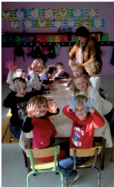
Temps d'activités périscolaires 2015/2016