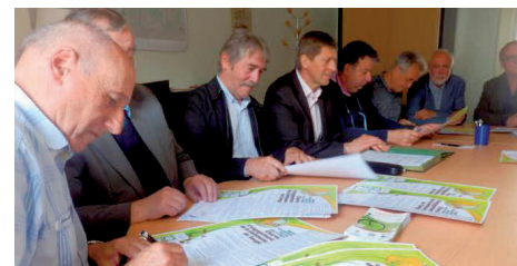
Le 6 juin 2016, les maires d'Arthon, Coings, Neuillay-les-Bois, Saint-Lactencin et Sougé ont signé la charte «Zéro pesticide»

Cette thématique sera abordée lors de la réunion publique du 17 novembre.