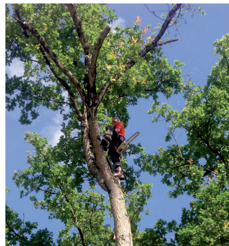
Abattage d'un arbre au Champ du Pont

Comme il s'y était engagé, le Conseil Municipal a fait réaliser des travaux respectant ses trois priorités d'économie d'énergie, d'amélioration de la sécurité et d'entretien du patrimoine. Quatre ralentisseurs ont été installés et devraient améliorer la sécurité du village. Le gymnase, qui a bientôt 25 ans, nécessite absolument la rénovation de son bardage et de son isolation. Quant à l'entrée du cimetière, son aménagement s'avérait nécessaire pour améliorer l'accès et faciliter le stationnement. Un nouveau columbarium et huit cavurnes en marguerite ont été installés.